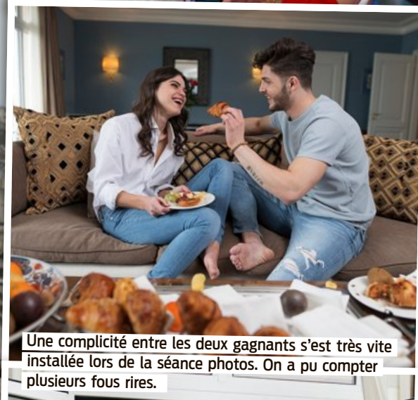
Une complicité entre les deux gagnants s'est très vite installée lors de la séance photos. On a pu compter plusieurs fous rires.