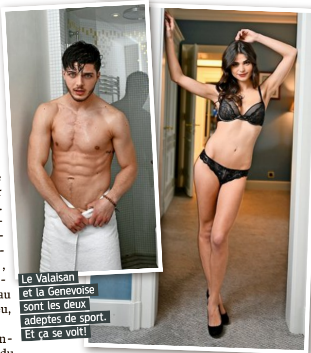
Le Valaisan et la Genevoise sont les deux adeptes de sport. Et ça se voit!

Alors qu'elle continue à se préparer, elle nous explique «adorer les sports extrêmes»: «J'aime les sensations fortes. J'ai fait du parapente, j'aime la vitesse du ski alpin et du monoski nautique. Mais je ne peux pas m'enfermer dans une salle de fitness. J'ai besoin de m'amuser lorsque je fais de l'exercice.» Elle ne tient pas en place. Tout comme ses parents, séparés aujourd'hui,